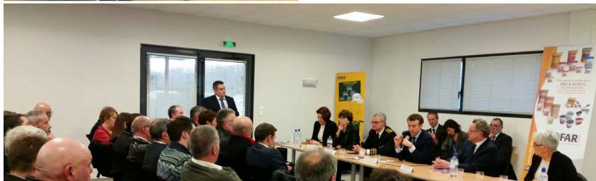
Lors de la visite de Breizh Usinage Services et avec les chefs d'entreprises de la région de Pleyben.