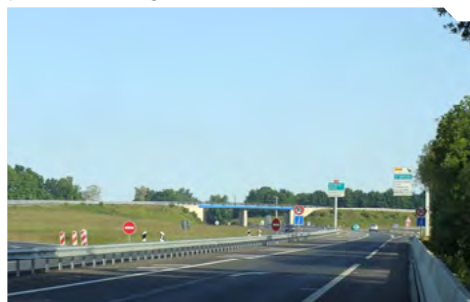
La RN 164, dont la mise à 2x2 voies sur sa partie finistérienne sera achevée en 2020.

D'ici à la fin de l'année, des objectifs simples et rassembleurs seront définis, et les moyens de les atteindre identifiés grâce à une large consultation publique et l'organisation de réunions publiques dans tous les territoires. L'année 2019 sera donc celle de la finalisation et de la diffusion de ce projet collectif, porteur des moyens concrets qui nous permettront d'atteindre nos ambitions pour la Bretagne de demain.