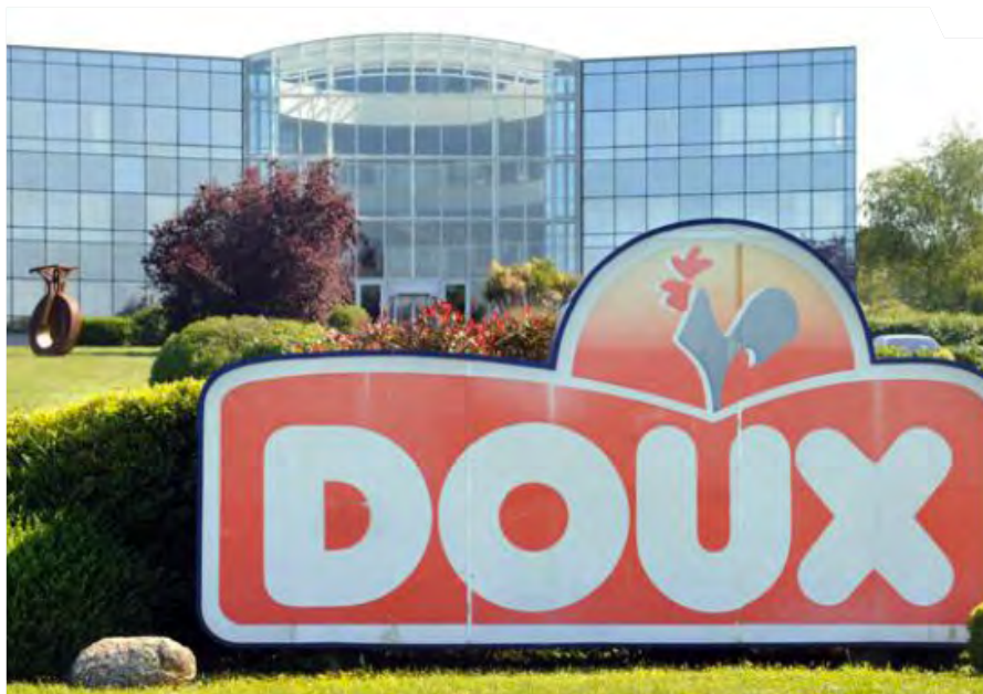
Le siège du groupe Doux, à Châteaulin..