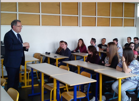
J'ai participé à plusieurs moments d'instruction civique dans les établissements scolaires de la circonscription. Ici, au lycée Jean Moulin à Châteaulin.