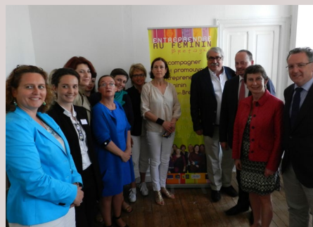
Clotilde Valter, Secrétaire d'État à la Formation professionnelle, est venue à la rencontre des acteurs de la formation et notamment d'Entreprendre au Féminin au Faou.