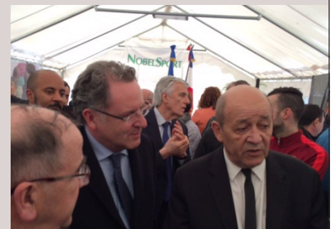
Sur le site de Nobelsport à Pont-de-Buis, Jean-Yves Le Drian, Ministre de la Défense, a tracé de belles perspectives de production et d'emplois pour notre territoire.